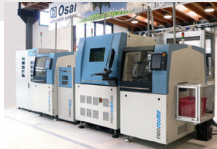
Il neorouter modula in linea

La manipolazione automatica delle schede separate, viene eseguita mediante l'ausilio di gripper (pinze di presa) o nozzle. La base di sistema modula, permette infatti di eseguire presa e posa di componenti e schede in blister, tape, o pallet in modo semplice e rapido.